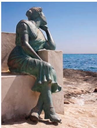
▲ La Bella Lola przy pasażu nadmorskim Paseo Marítimo Juan Aparicio

Wybrzeże na południe od Torrevieja aż do DEHESA DE CAMPOAMOR zabudowane jest osiedlami domków turystycznych, hotelami i apartamentowcami, z których największe jest urbanización Playa Flamenca z ładnymi piaszczystymi plażami. W Dehesa de Campoamor znajduje się duża marina z portem żeglarskim 📍 www.cncampoamor.com , a w okolicach pola golfowe.