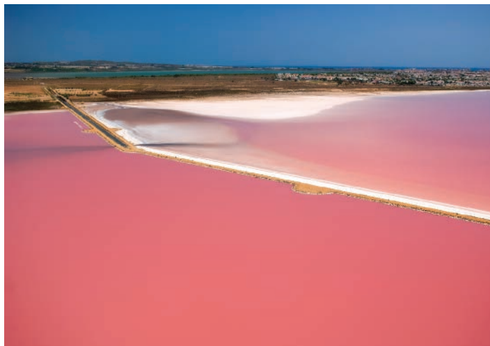
▲ Saliny Torrevieja – Laguna Rosa

Przy sennym, tonącym w zieleni rynečku Plaza de la Constitución wznosi się neoklasyczny XVIII-wieczny kościół Niepokalanego Poczęcia NMP – Iglesia Arciprestal de la Inmaculada Concepción , odbudowany po trzęsieniu ziemi w 1844 r. Do jego budowy wykorzystano resztki kamieni po dawnej wieży Torre Vigía de las Eras, od której miasto wzięło swoją nazwę. We wnętrzu świątyni można zobaczyć obraz Matki