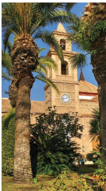
▲ Plac Konstytucji z kościołem Niepokalanej Poczęcia NMP

Życie tętni wokół dużego portu – przy pasażach nadmorskich pełnych kawiarni i restauracji. Najbardziej charakterystycznym budynkiem jest dawne Casino z 1896 r. przy Paseo de Vistalegre. Styl architektoniczny łączy secesję z elementami neomozarabskimi. Dzisiaj mieści się tu popularna