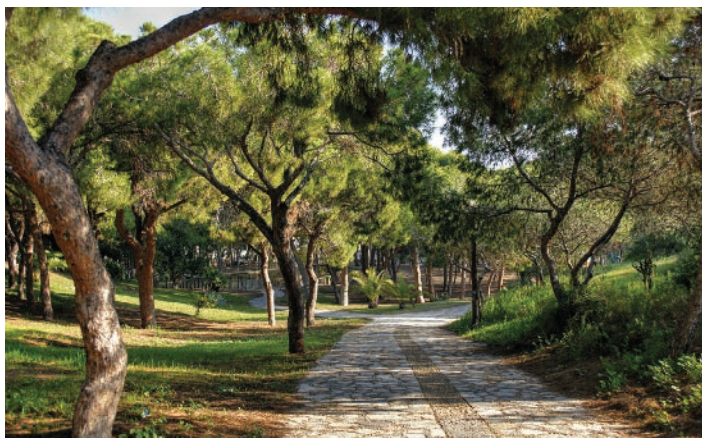
▲ Sosny w miejskim parku (Parque Reina Sofia)