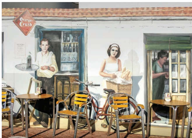
▲ Mural w kawiarni Movellan