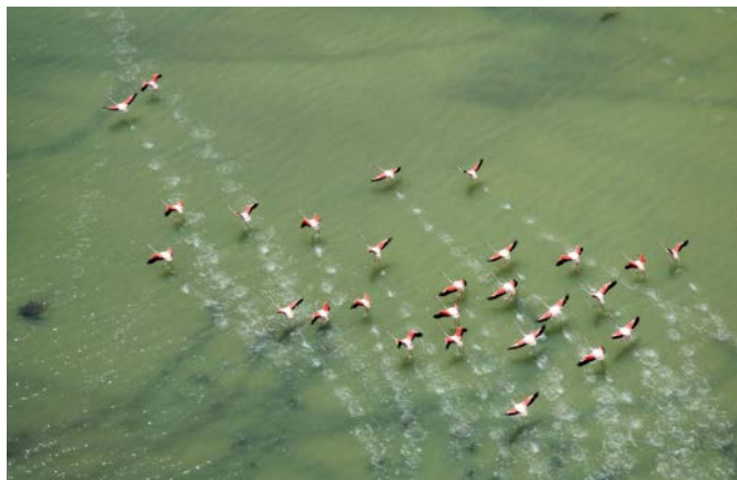
▲ Flamingi na salinach Santa Pola

W części parku obejmującej wybrzeże przy naturalnych plażach wyznaczono dwie inne edukacyjne ścieżki przyrodnicze: El Tamarit (3 km, 1,5 godz., zobaczymy tu m.in. dawne elementy infrastruktury do eksploatacji soli) i El Pinet (3,8 km, 1 godz. 15 min; laguna solna, ekosystem wydm itd.) – mapkę tras dostaniemy w Muzeum Soli. Wokół salin Santa Poli prowadzi także szlak pieszo-rowerowy GR-232 o długości 26 km (odcinek wzdłuż wybrzeża trzeba pokonać pieszo). Na trasie zobaczymy typowy krajobraz jezior solnych oraz charakterystyczną wieżę obronną Torre de Tamarit z XVI w., która była częścią systemu obronnego z czasów króla Filipa II m.in. przed atakami piratów berberyjskich.