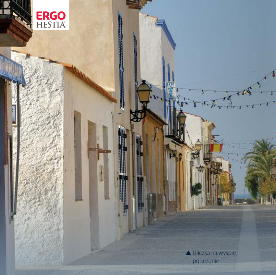
▲ Uliczka na wyspie – po sezonie

lokalne potrawy. W sezonie letnim odwiedza Tabarcę nawet 3000 turystów dziennie, kuszonych niesamowitą historią miejsca i sławą dań rybnych, w których specjalizują się rodzinne restauracje. Jednym z przysmaków jest ryż arroz caldero ( caldero tabarquí ) – przyrządzany na wywarze z ryb złowionych przy skalistych brzegach wyspy, o bardzo charakterystycznym, intensywnym smaku, przyprawiony lokalną papryką zwaną ñora (to podstawowa obok szafranu przyprawa do potraw z ryżu, paelli itd.).