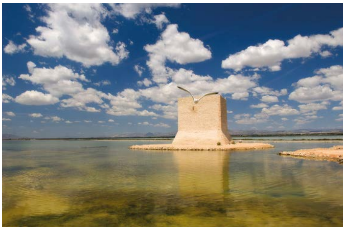
▲ Saliny Santa Pola