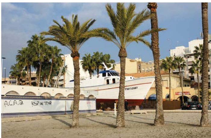
▲ Barco Museo Esteban González

Tabarca), powstał zamek obronny, w którego murach mogli schronić się rybacy i kupcy. Nowy rozwój portu oraz towarzyszący mu wzrost zaludnienia nastąpił wraz z zasiedleniem wyspy Tabarca przez uchodźców liguryjskich w XVIII w. (zob. s. 96).