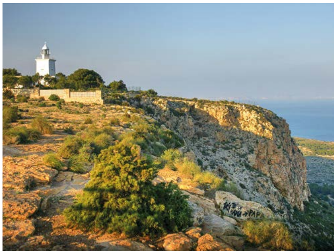
▲ Latarnia morska w najwyższym punkcie Cabo de Santa Pola

📍 O mapkę szlaków zapytajmy w informacji turystycznej lub wypożyczalni rowerów. Warto polecić Cycling Port , c. Alfonso XII 10, tel. +34 966 693 297, www.cyclingport.com , wynajem roweru na pół dnia 8 EUR, na cały dzień 12 EUR, depozyt 20 EUR.