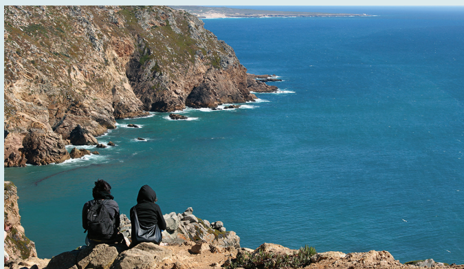
Widok na Costa Vicentina

Spędź sobotni poranek na targu w Loulé – spotykają się tu lokalni rolnicy sprzedający warzywa ze swoich ogródków. Na straganach ustawionych w pięknej neomauretańskiej hali można kupić ekologiczne owoce i warzywa, a także świeże ryby! Zob. s. 43 i s. 97.