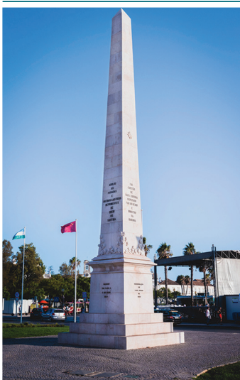
Obelisk na Praça Dom Francisco Gomes

przedstawiająca boga oceanów (III w.). Pochodzi ona z jednego z domów przy rua Dom Henrique w Faro. Na piętrze, w sali poświęconej sztuce sakralnej, można podziwiać bogatą kolekcję malarstwa (XVI–XIX w.). W kilku salach organizuje się wystawy czasowe, a w niektóre letnie wieczory w wirydarzu odbywają się koncerty (muzyka klasyczna, jazz, fado) lub projekcje filmów (w lipcu, repertuar na miejscu).