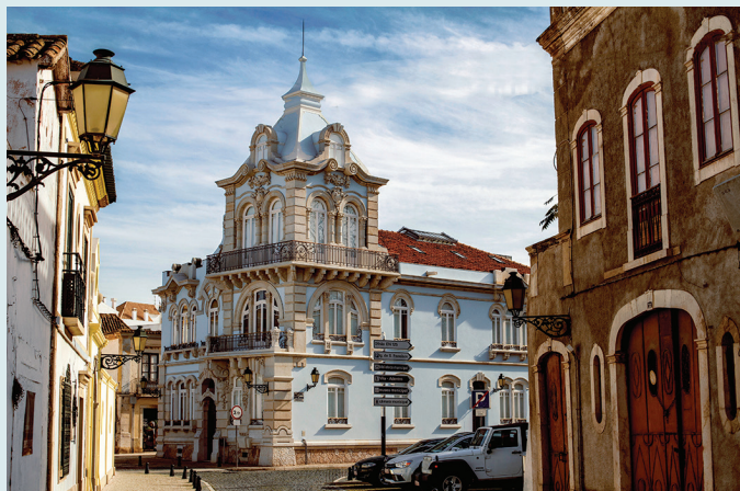
Palacete Belmarço na starym mieście w Faro

Spotkaj się z oceanem na wybrzeżu Costa Vicentina w okolicy Arrifana lub Carrapateira – dwóch miejscowości, do których najczęściej przybywają surferzy zwanieni najwyższymi falami. W zachodniej części Algarve, w otoczeniu dzikich, zapierających dech w piersiach krajobrazów czekają cię pełne adrenaliny przeżycia. Zob. s. 47 i s. 123.