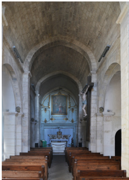
Nawa główna, prezbiterium

Dekoracje rzeźbiarskie – baptysterium, krucyfiks, rzeźbę Michała Archanioła – wykonał Alexis Poitevin z Roussillon w 1791.