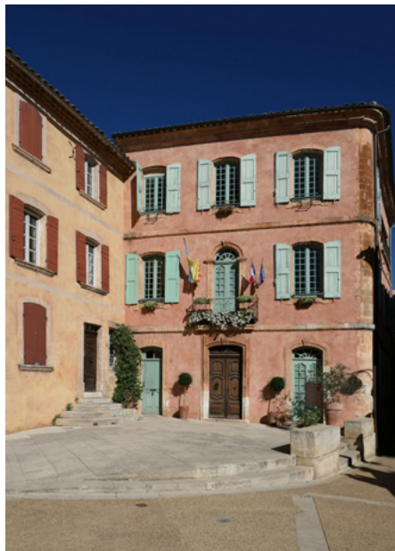
Ratusz, elewacja zachodnia

Siedziba władz lokalnych znajduje się na skraju Camille Mathieu, przy place de la Mairie 2.