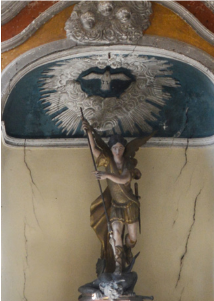
Figura Michała Archanioła w ołtarzu w nawie północnej

Figura Michała Archanioła, patrona kościoła i Roussillon, znajduje się w ołtarzu w nawie północnej.