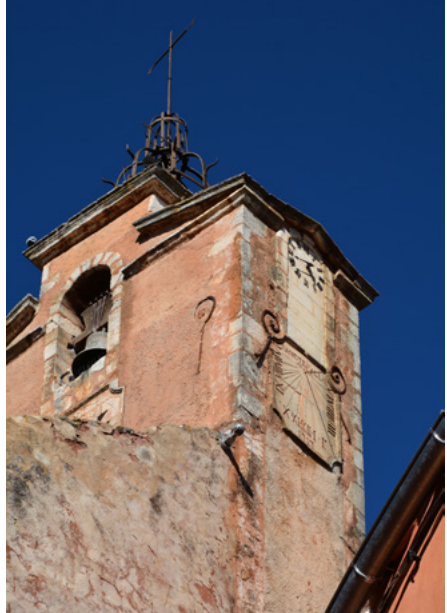
Elewacja południowa i zachodnia wieży z chemin de Ronde

Furta do kościoła, obok wieży, przy murze wschodnim