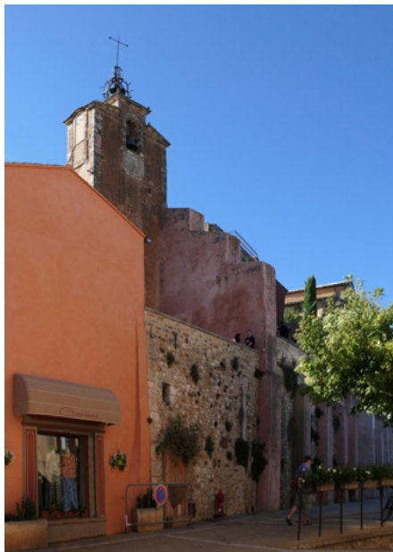
Place Camille Mathieu, pierzeja zachodnia, mury miejskie