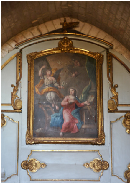
Zwiastowanie – obraz w prezbiterium