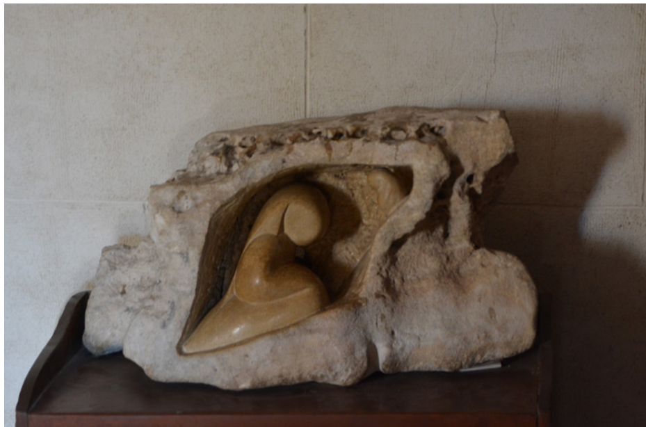
Rzeźba przedstawiająca Matkę Boską i Dzieciątko

W kościele są też dzieła współczesnych twórców, m.in. obraz przedstawiający szopkę (fot. poniżej), dzieło Raoula Lebel (1907–2006), rumuńskiego malarza, który w 1962 r. wyemigrował do Paryża, mieszkał też w Roussillon.