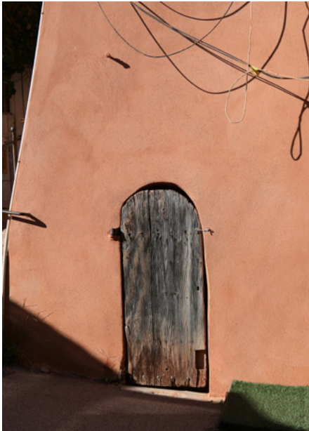
Rue de Jeu de Paume