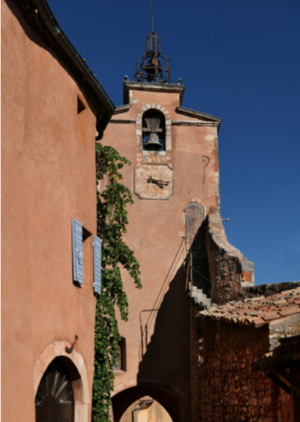
Elewacja zachodnia wieży dzwonnicy, bramnej, z rue de l'Église

Dawna wieża muru obronnego (fr. beffroi), z 4 zegarami słonecznymi, w XIX w. stała się dzwonnica kościoła św. Michała.