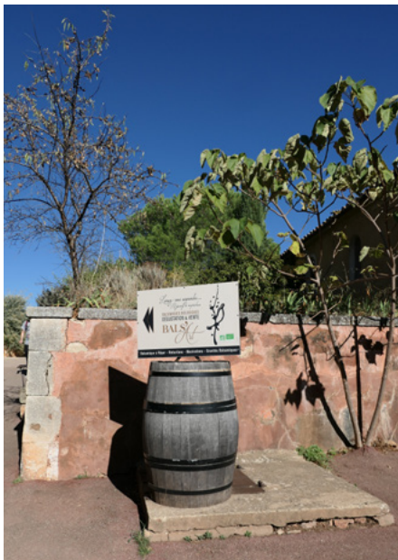
Place du Castrum