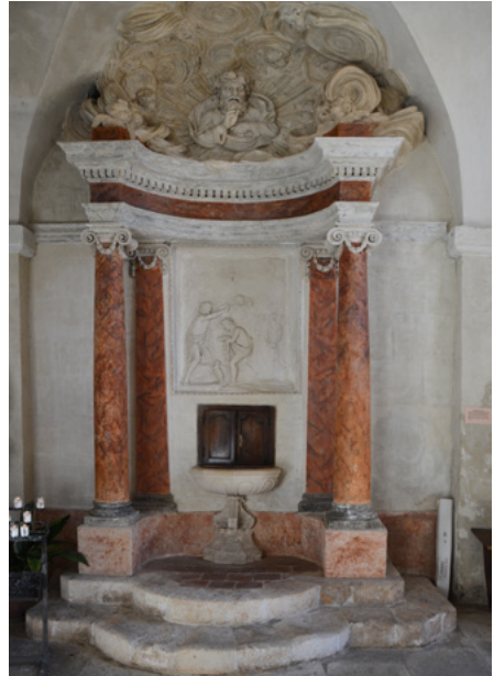
Klasycyistyczne baptysterium (XVIII w.) w nawie południowej