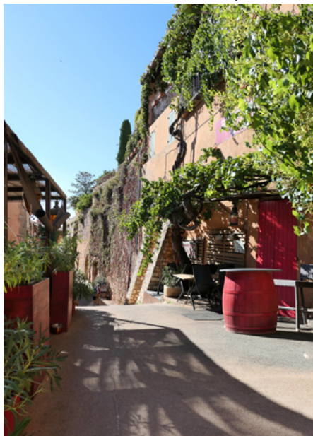
Rue de Jeu de Paume, mury południowe starego miasta