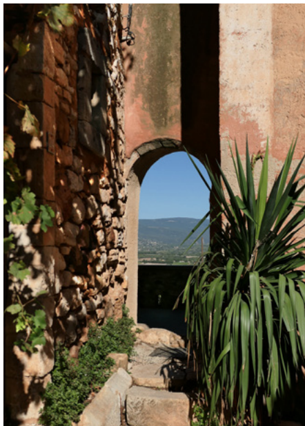
Furta obok wieży, przy murze wschodnim

Zegar słoneczny (nieopodal wejścia na szlak ochry) pełni też funkcję kalendarza. Wykonał go Jean Raffegeau.