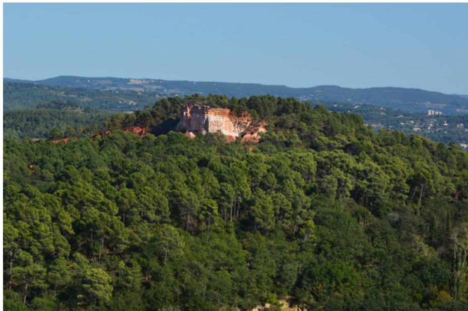
Widok ze starego miasta

Liczne ochrowe skały, widoczne z różnych punktów w Roussillon, tworzą malowniczy krajobraz.