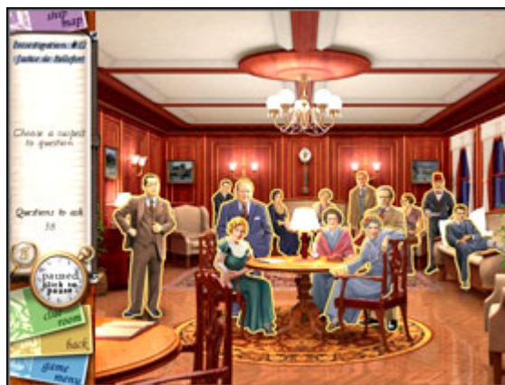
Salon wypełniony podejrzanymi o morderstwo.