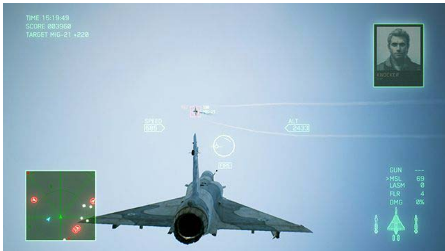
Widok dyszy silnika wroga to pewny strzał.

Skuteczne trafienie rakietą zaliczysz siedząc na ogonie przeciwnika, gdy ten się od Ciebie oddala. Nie strzelaj, jeśli samolot przelatuje z lewej strony na prawą lub zmierza w twoim kierunku dużo wyżej lub poniżej Twojej pozycji. Rakietą prawie na pewno chybi celu. Zajmij dogodną pozycję za wrogiem zmniejszając prędkość i manewruj obserwując wektor strzałki na środku ekranu. Pamiętaj, że wrogie myśliwce i bombowce wymagają dwukrotnego trafienia standardową rakietą , drony spadają po jednym strzale.