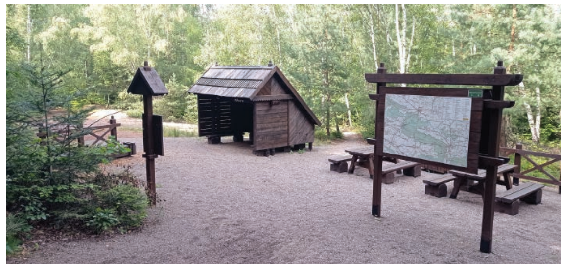
Przystanek ścieżki edukacyjnej „Szlakiem kolejki wąskotorowej” na trasie Nowa Słupia – Święta Katarzyna w Świętokrzyskim Parku Narodowym