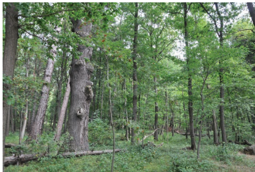
Góra Chełmowa w Świętokrzyskim Parku Narodowym