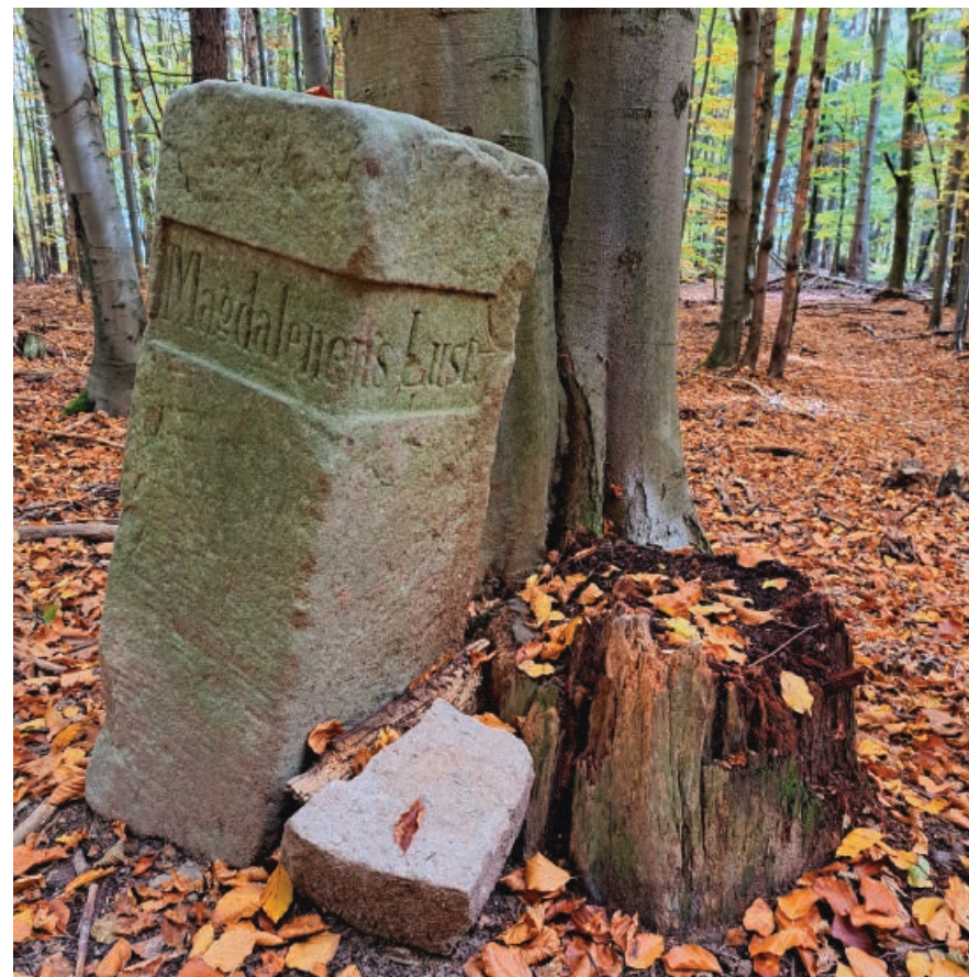
Znak prowadzący do punktu widokowego Ochota Magdaleny.